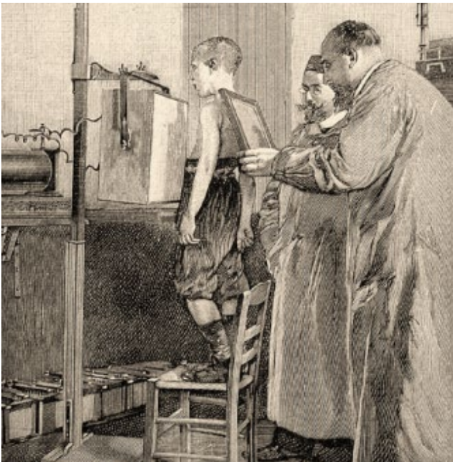
Wilhelm Conrad Röntgen untersucht ein Kind (ca. 1900).